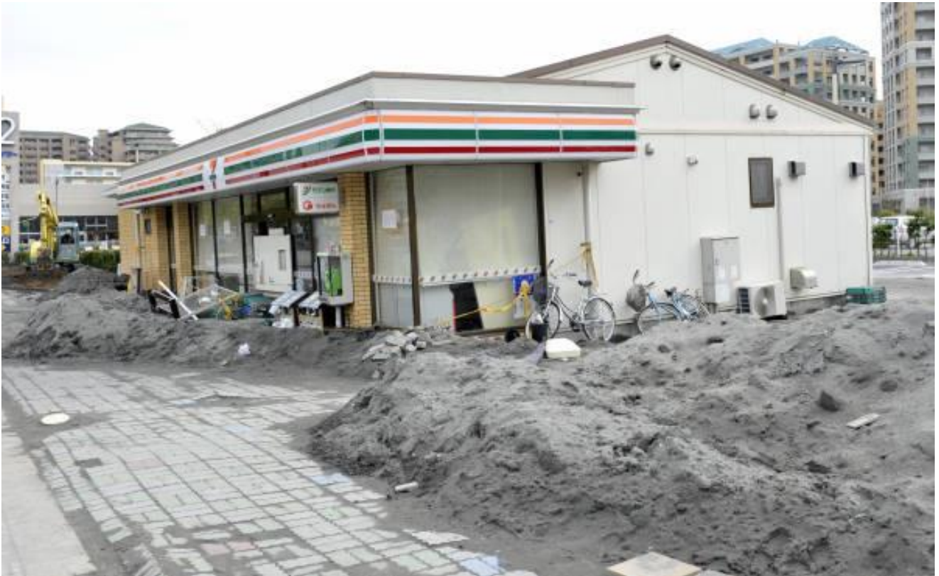
液状化現象で傾いたコンビニエンスストア（千葉県浦安市明海）