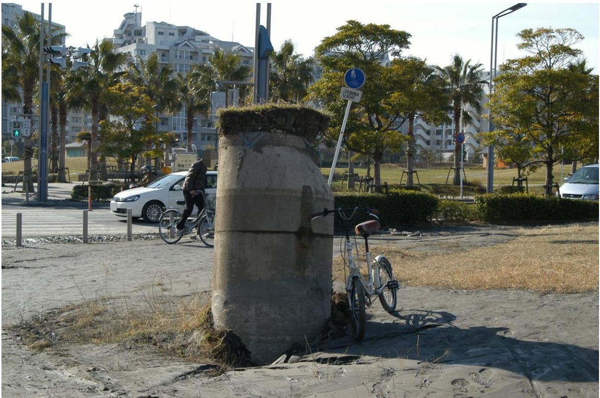
浮き上がったマンホール（千葉県浦安市明海）