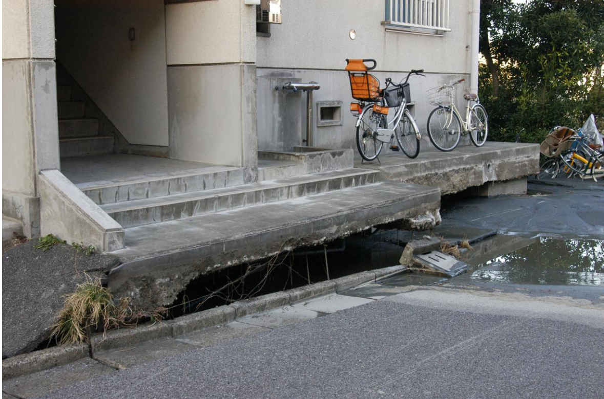
液状化現象による地盤沈下でできた段差（千葉県浦安市高洲）