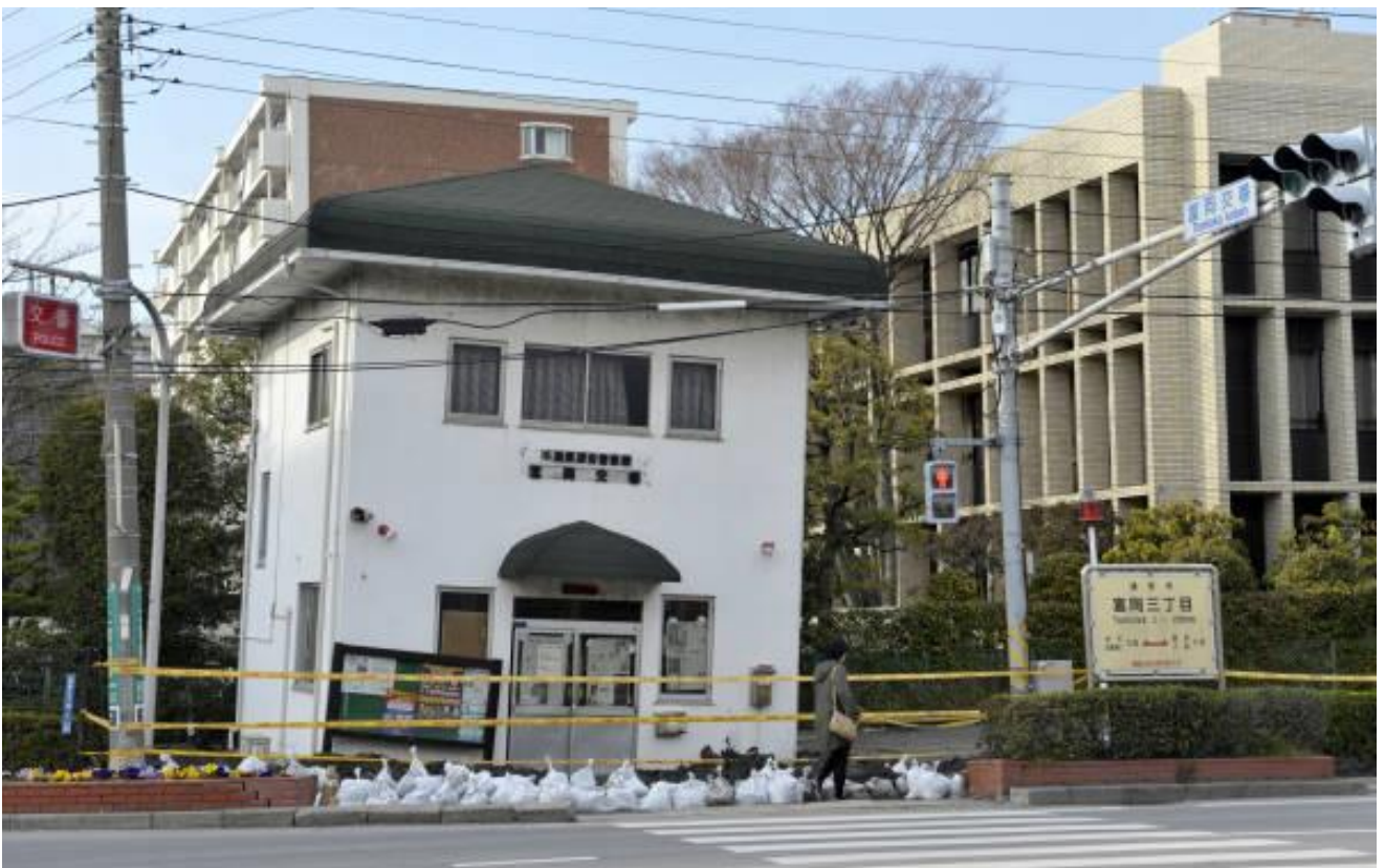
液状化現象で傾いた富岡交番（千葉県浦安市富岡）